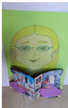
Gesicht mit Hand: